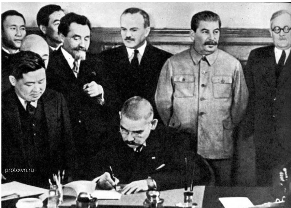
Мацуока подписывает Договор о нейтралитете

Гитлеровское нападение на СССР не было сюрпризом для Мацуока, которому ясно дали понять об этом во время его визита в Берлин, накануне подписания советско-японского Договора о нейтралитете. Другое дело, что немцы вновь отнеслись к своим союзникам довольно небрежно – о начале войны японцы узнали лишь из средств массовой информации. Выступая 25 июня на заседании координационного комитета японского правительства и ставки Мацуока заявил: «Когда Германия победит и завладеет Советским Союзом, мы не сможем воспользоваться победой, ничего не сделав для неё» [3, с. 233].